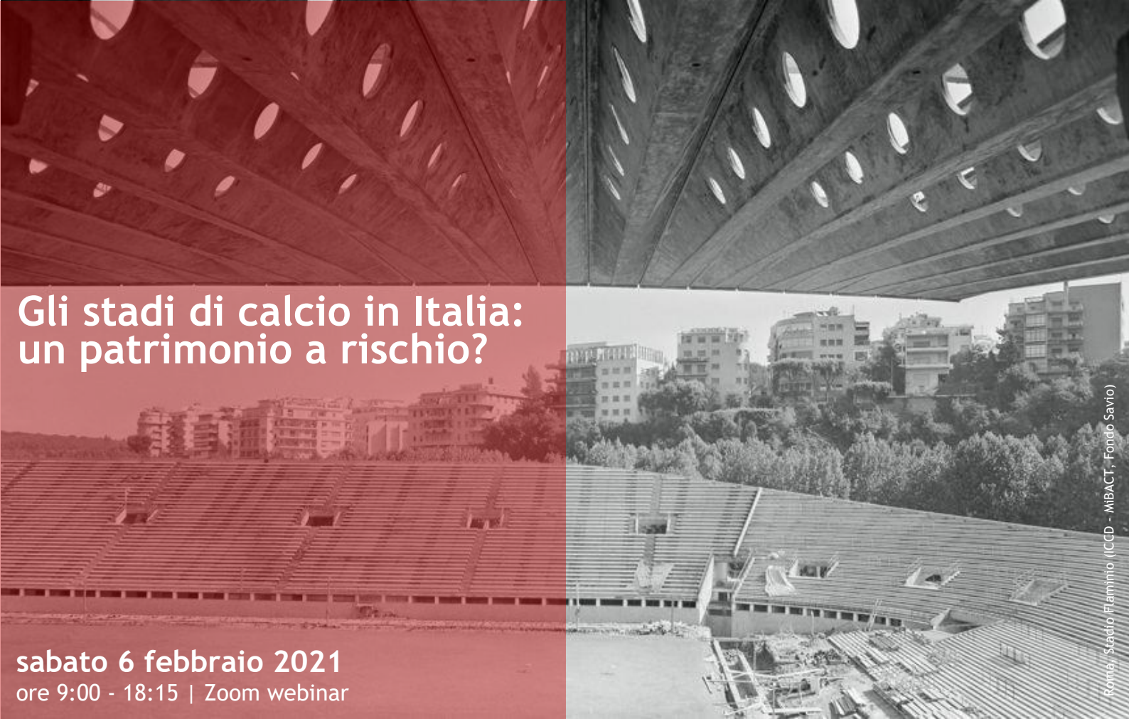
Roma, Stadio Flaminio